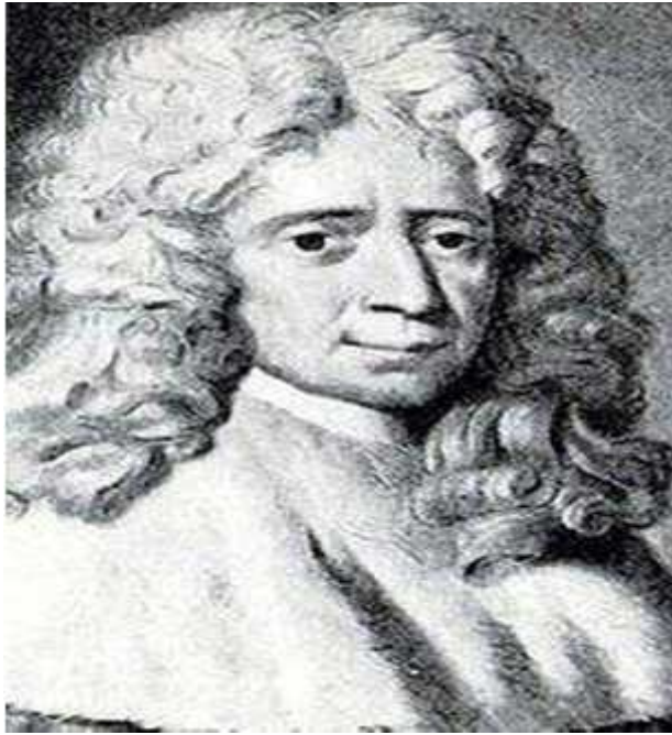
مونتسكيو ( Montesque ) القوانين

تميز به صورته البدوية والحضرية. واشتهر بصغيرة إقليم تفسيره للتاريخ بتقسيمه الاقتصادية أقاليم تميزت بتمعنه وفحصه الدقيق. وتحليله تظهر الإقليم وتميز وهو بهذا يعتبر نظرية نظرية ظهرت في أوروبا. حياة 1- النظرية الحتمية: