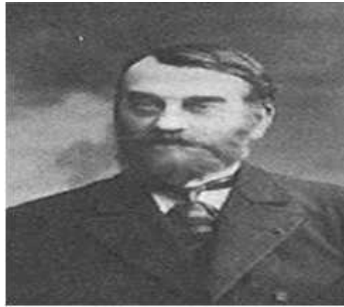
- أبرز رواد المدرسة الإمكانية

يعتبر فيدال الإمكانية. فيقترح "إمكانية" ينضاف Paul Vidal de La Blache هذا التيار كتصحيح للحتمية الجغرافية هو الطبيعية، أنه " أنه يجب يجعل غير . تظهر إمكانية المشاريع أقامها يشكل كبيراً تعديل بيئته تهيئتها لمتطلباته احتياجاته. هذا التيار كونهم البيئية، هذه السيادة البيئية يصل به السيادة الدكتاتورية البيئية، هذه السيادة البيئية عديدة " البيئي". قد أعترض على الحتمية راتزل وأتباعه ونادى باحترام قدرات الأنسان وإمكانياته، ومع اعتراف (الإمكانين) بسيادة الانسان وسيطرته على الممتلكات إلا أنه لا يملك الحرية الكاملة في تغير بيئته إذ مازالت تضع أمامه حدود لم يستطيع أن يجتازها فقلة الامطار وندرة المياه لا تيسر قيام حياة والإمكانين بصفة عامة أكثر حذراً وحيطة من الحتميين في معالجة موضوع العلاقة بين الأنسان والبيئة، والخلاصة أن الجغرافية في نظر أصحاب الإمكانية لم تكن مهمتها في أي ناحية من نواحي دراستها هو البحث عن القوانين الجغرافية أوضعها وإنما مهمتها الأساسية هو دراسة الأ