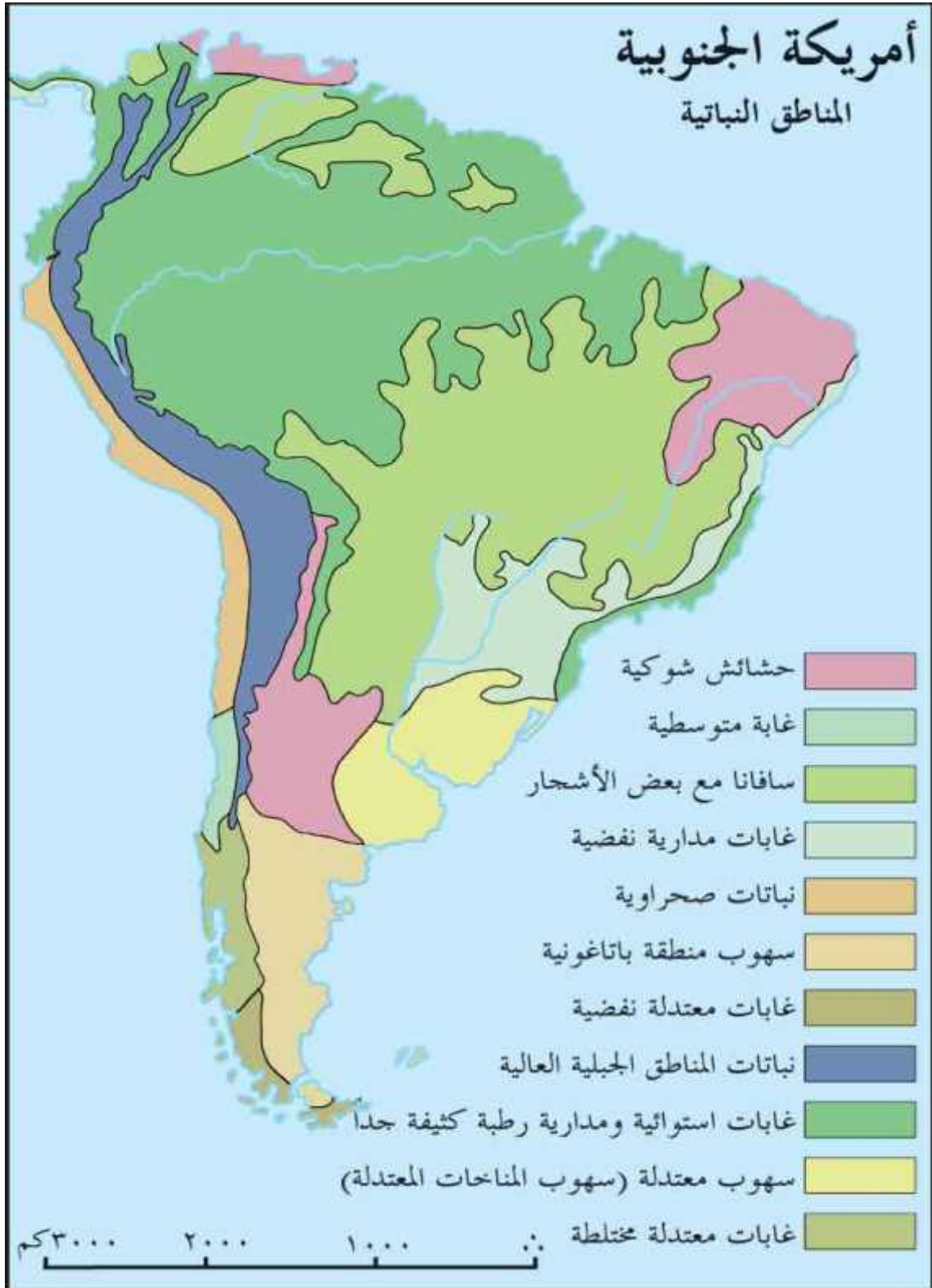
(5) الأقاليم النباتية في قارة أمريكا الجنوبية

المناطق التي يتراوح ارتفاعها ما بين (1000-2000) المخروطية المناطق العالية حيث الجليد والتي تعرف بـ (تيراه لارا)