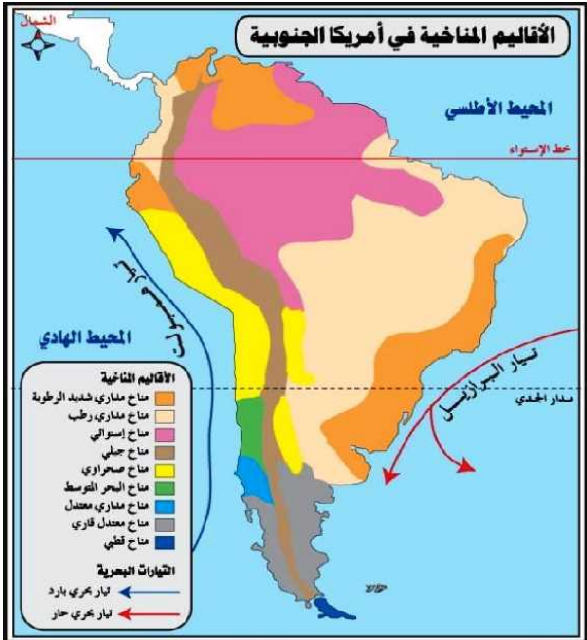
(4) الاقاليم المناخية في قارة أمريكا الجنوبية

يمكن من خلال التباين في الخصائص المناخية المختلفة في قارة أمريكا الجنوبية (4) أن تقسم الى الاقاليم التالية :-