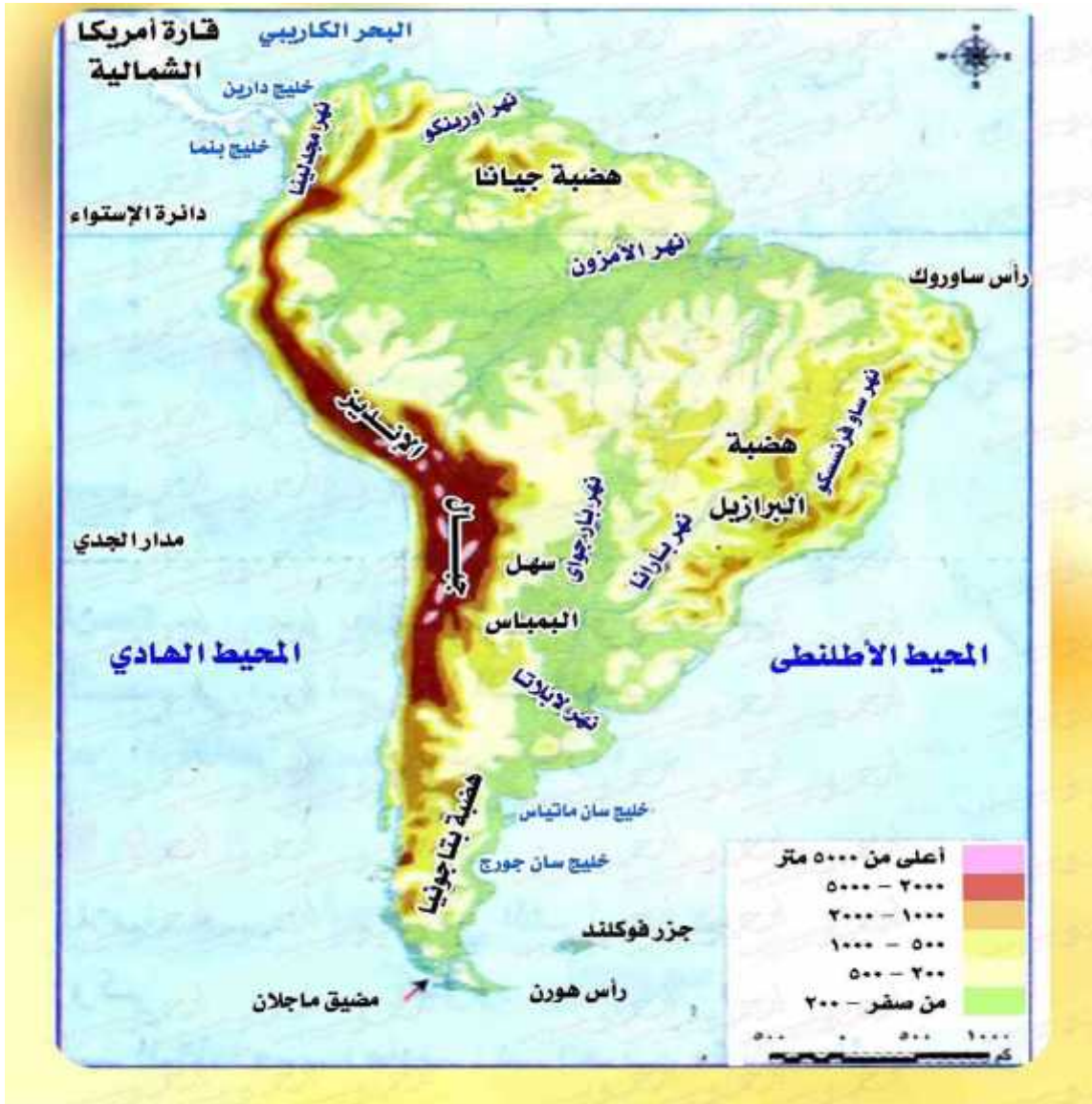
(2) الاقاليم التضاريسية في قارة أمريكا الجنوبية

3-السهول الوسطى، حيث تشغلها أنهار الأحواض الرئيسية ( ي )