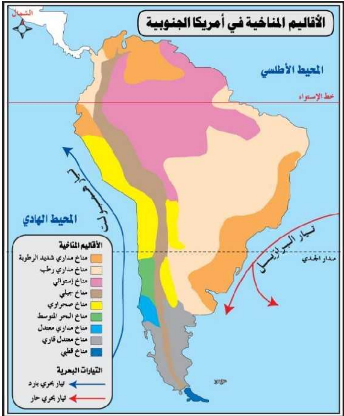
(3) الأقاليم المناخية في قارة أمريكا الجنوبية