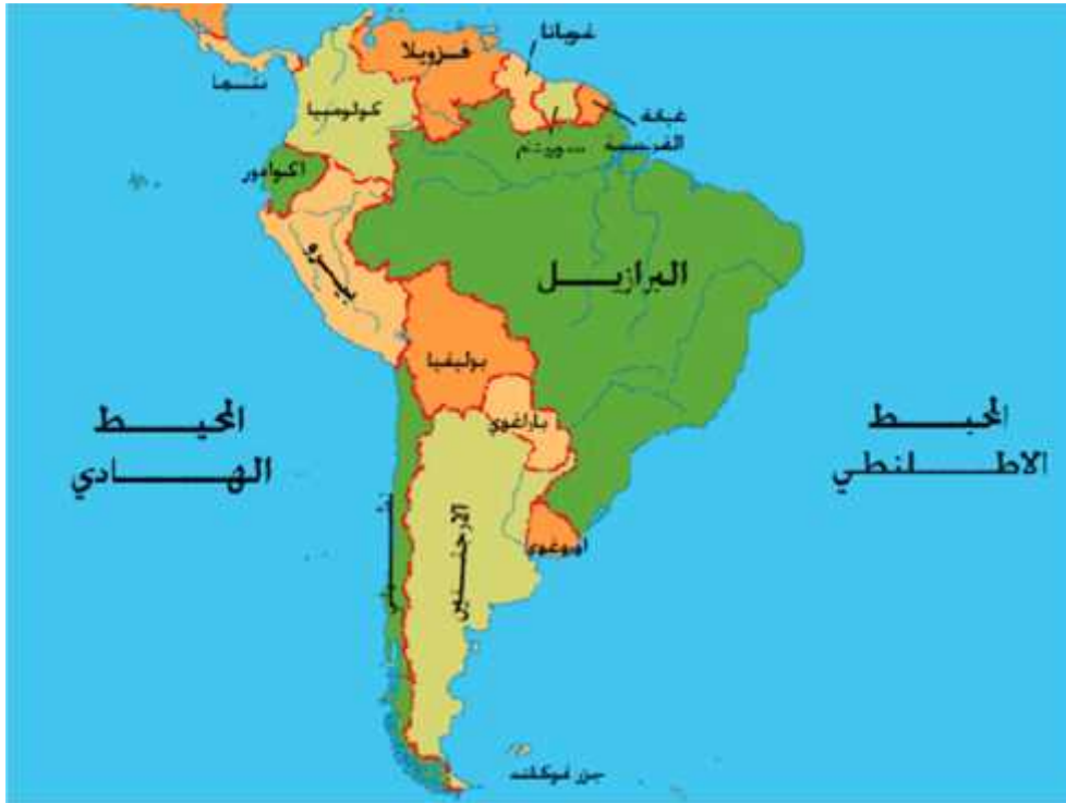
( 1 ) موقع قارة أمريكا الجنوبية

الإجمالية (18) مليون كم 2 (737 700) مليون نسمة حسب (2005) ويكون ترتيبها الرابع في القارات من حيث المساحة بعد القارات (آسيا، أفريقيا، أمريكا الشمالية) والخامسة من حيث تعداد السكان بعد كل من ( آسيا ، أفريقيا ،أوربا ،أمريكا الشمالية ).