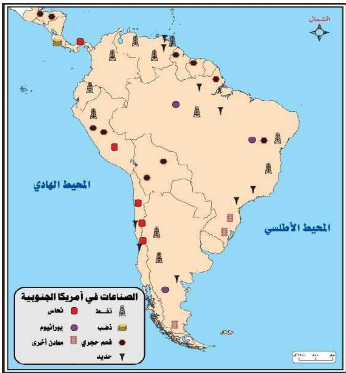
(7) الصناعات في قارة أمريكا الجنوبية

تتنوع مصادر الطاقة في القارة كذلك بتنوع تركيبة القارة الجيولوجية من جهة ومن مظاهر السطح من جهة اخرى ونوعية المناخ من جهة ثالثة ، اذ ان الفحم والنفط والغاز الطبيعي تعتمد في توزيعها على طبيعة تكوينها في حين تتوزع الطاقة الكهرومائية تبعاً للتضاريس وكمية الامط تموين المساقط الطبيعية بالمياه وتأتي فنزويلا في مقدمة اقطار القارة وهي عضو مؤسس في مذ