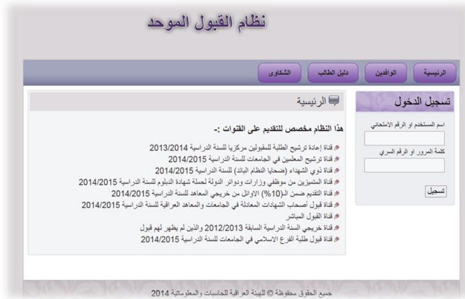
شكل رقم (١) الواجهة الرئيسية لنظام القبول الموحد