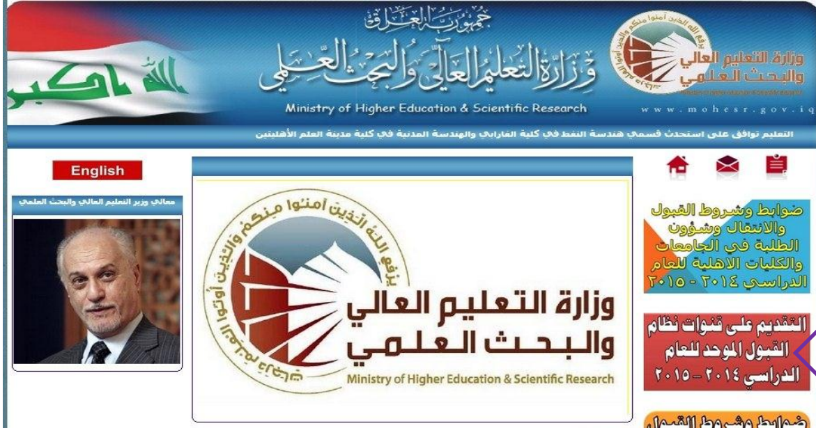
شكل رقم (٢) الواجهة الرئيسية لموقع الوزارة الإلكتروني

في لوحة المفاتيح سوف تظهر أمامك الصفحة الرئيسية لموقع وزارة التعليم العالي والبحث العلمي، حيث ستجد رابط (التقديم على قنوات القبول الموحد) وكما مبين في الشكل رقم (٢) وبالضغط على الرابط ستظهر أمامك عزيزي الطالب الصفحة الأولى لموقع الإستمارة الإلكترونية.