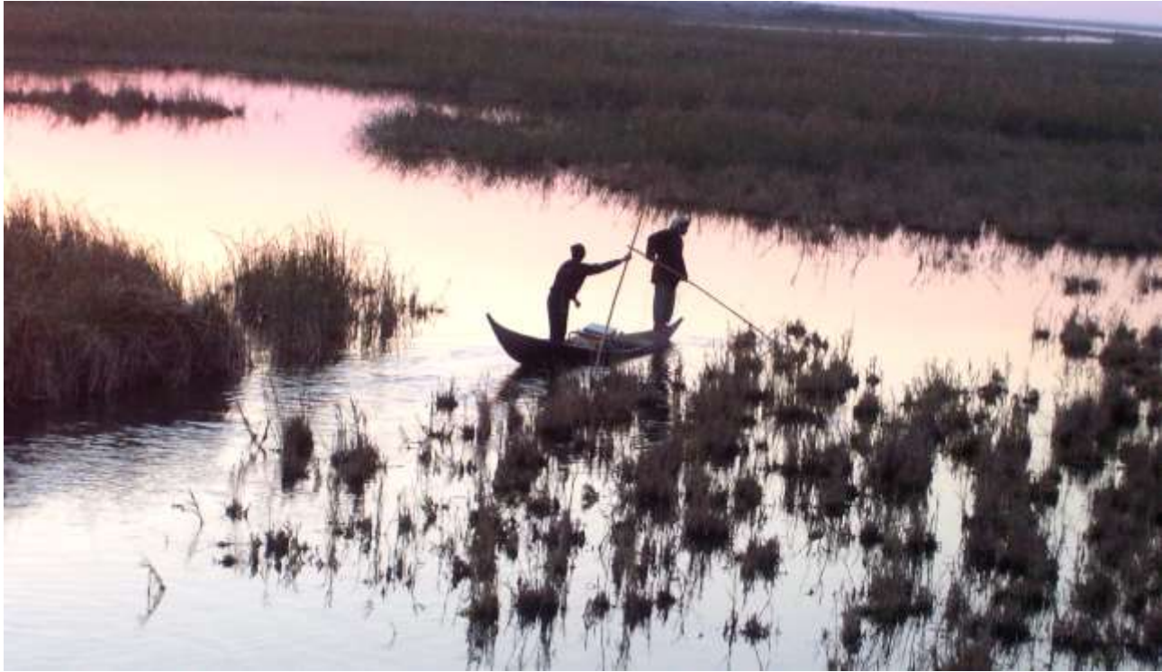
صيد السمك باستعمال الكهرياء