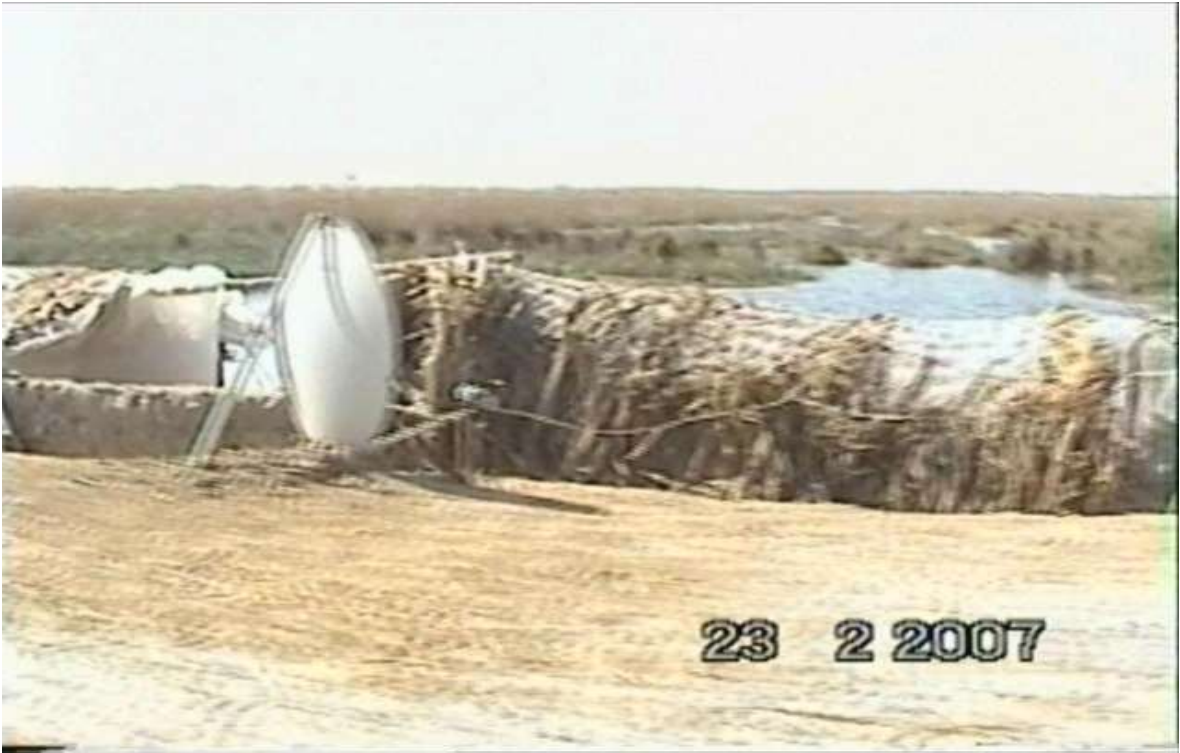
جهاز البث الفضائي: احد عناصر التكنولوجيا