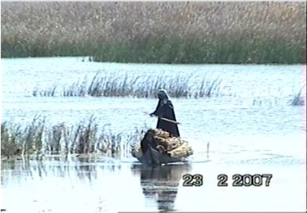
احد سكان هور الحمارة ذاهبا لبيع القصب