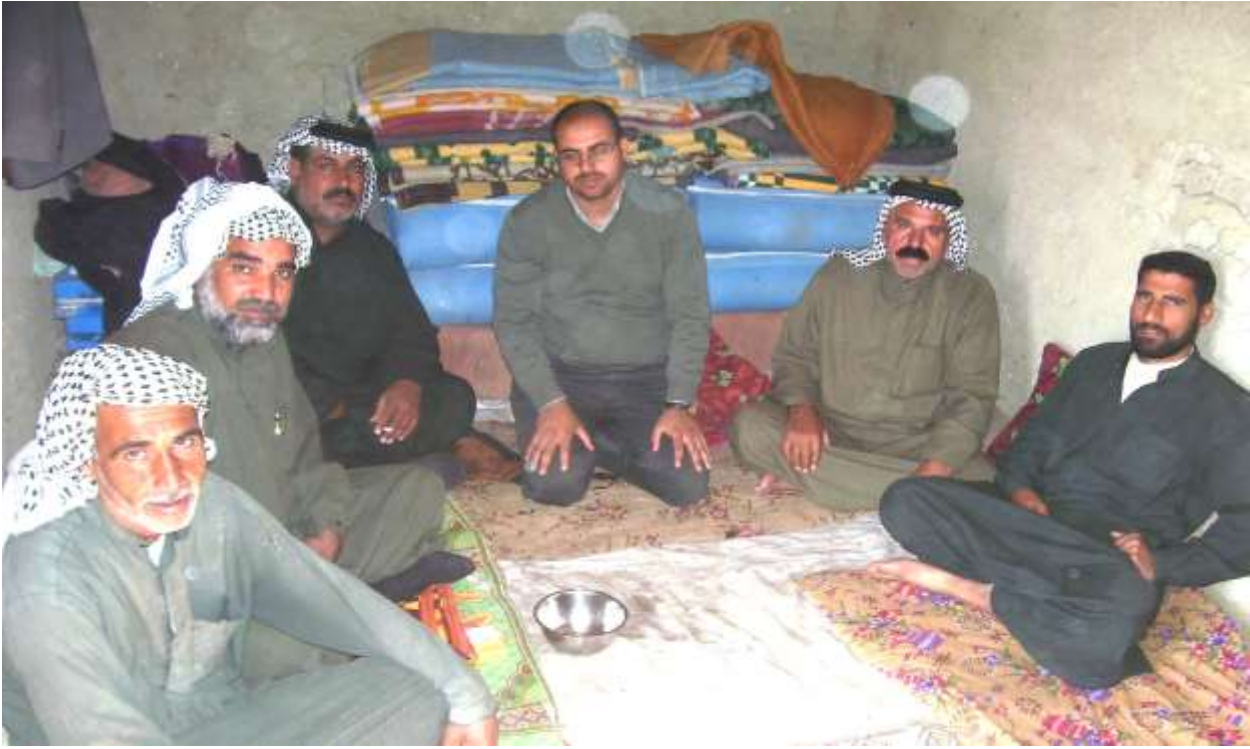
الباحث مع مجموعة من سكان هور الحمار