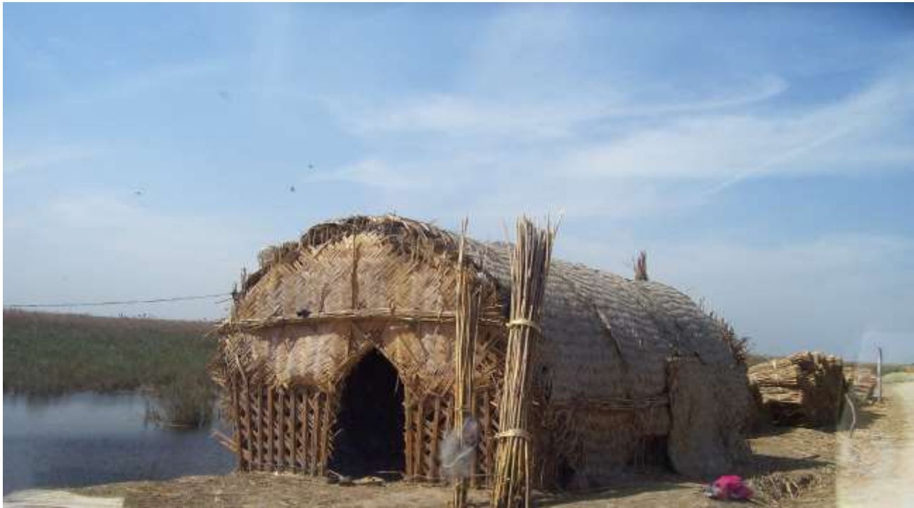
احد المساكن المشيدة على السداد الترابية