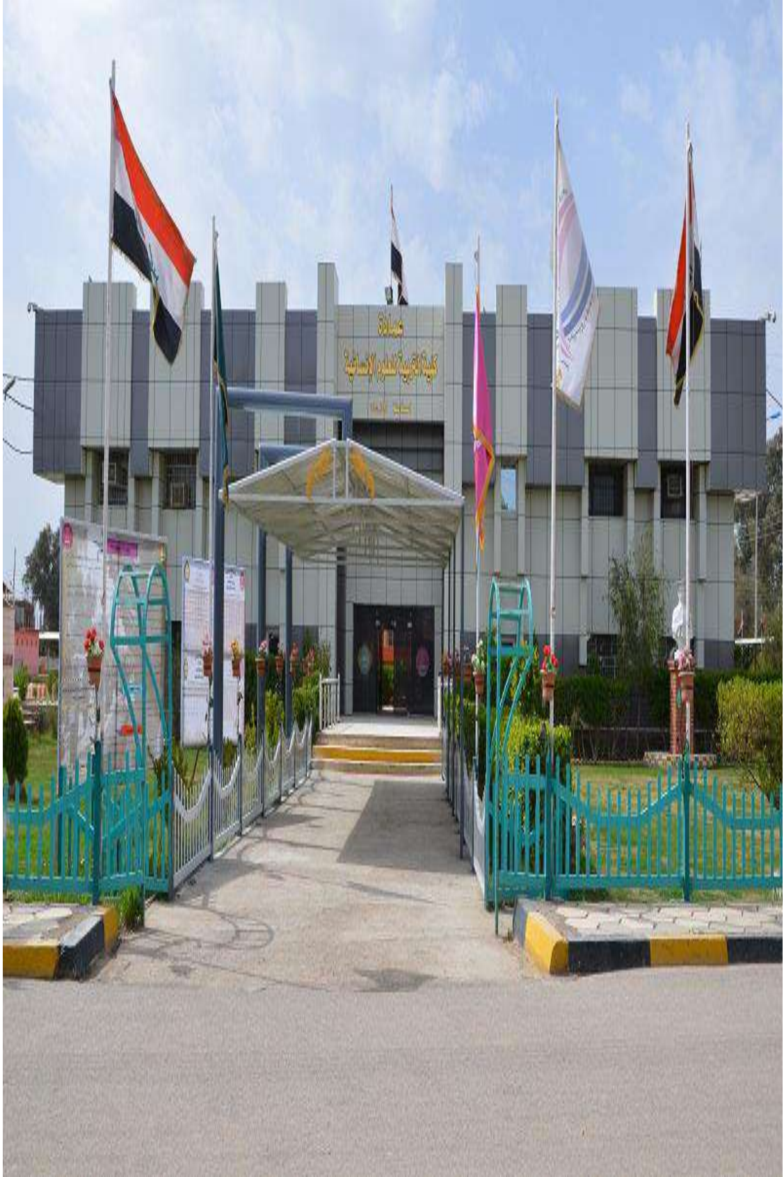
بناية عمادة الكلية