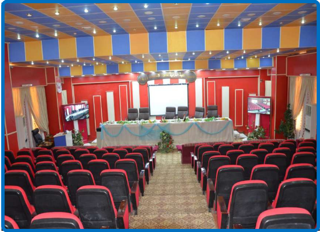
قاعة العلامة مصطفى جواد من الداخل