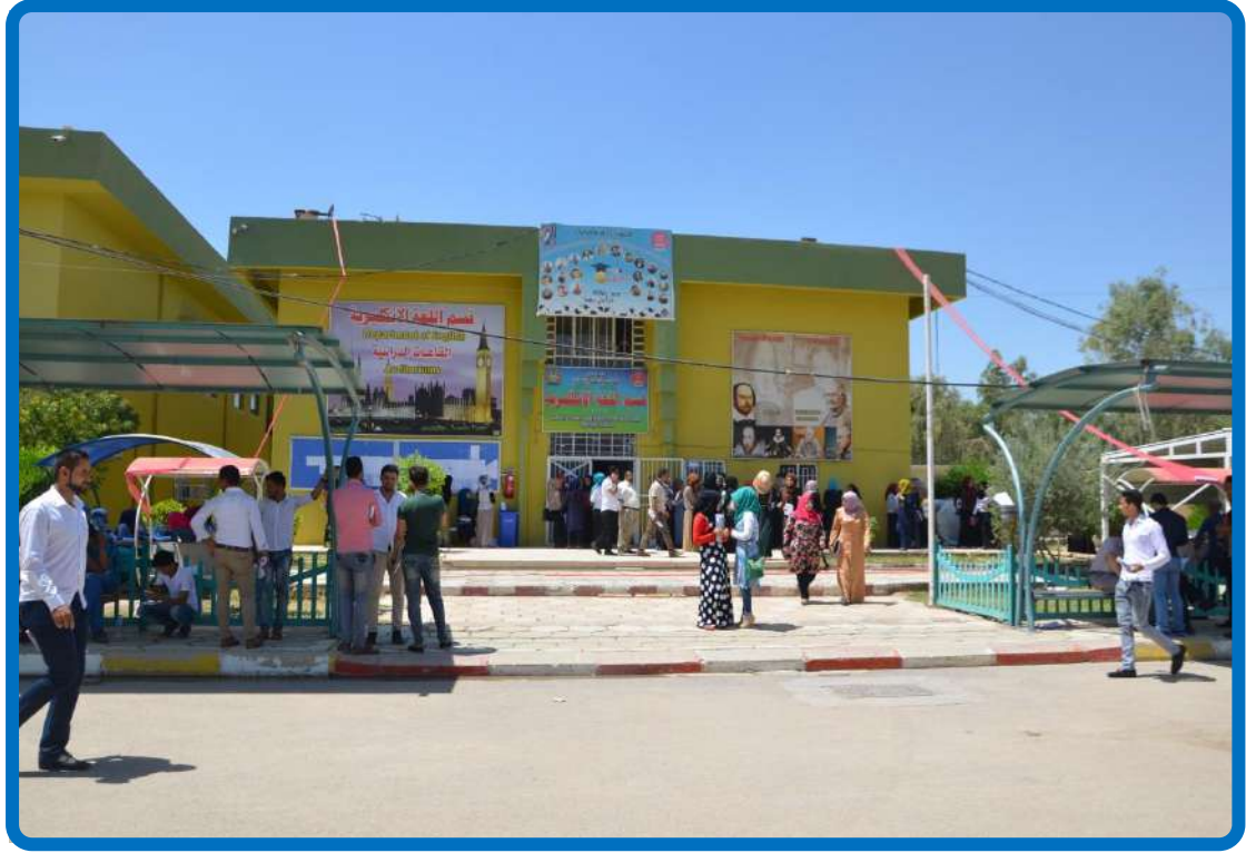
بناية قسم اللغة الإنكليزية