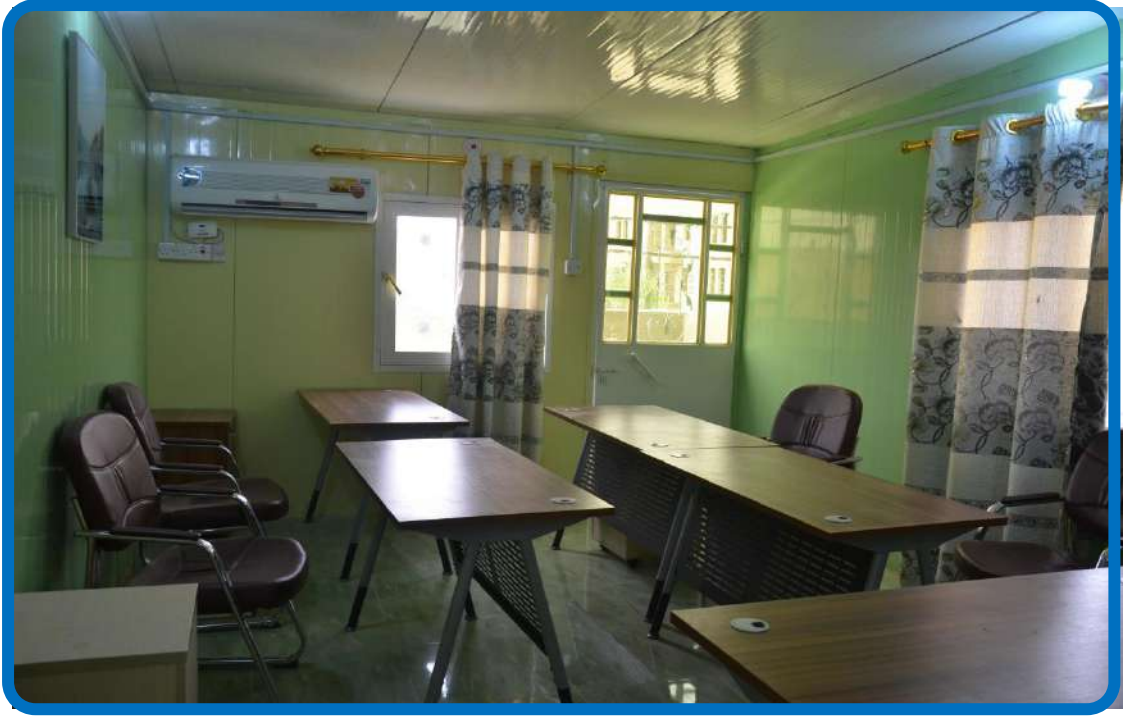
قاعة دراسات عليا مطوره (٢٠١٦م)