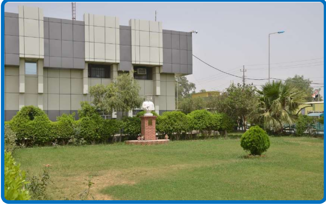
منظر جانبي لعمادة الكلية وحدائقها عام (٢٠١٦م)