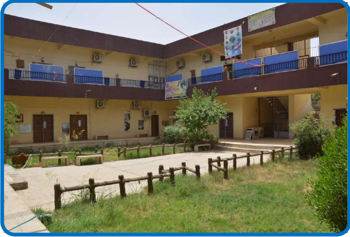
بناية القاعات الدراسية لقسمي التاريخ والجغرافية