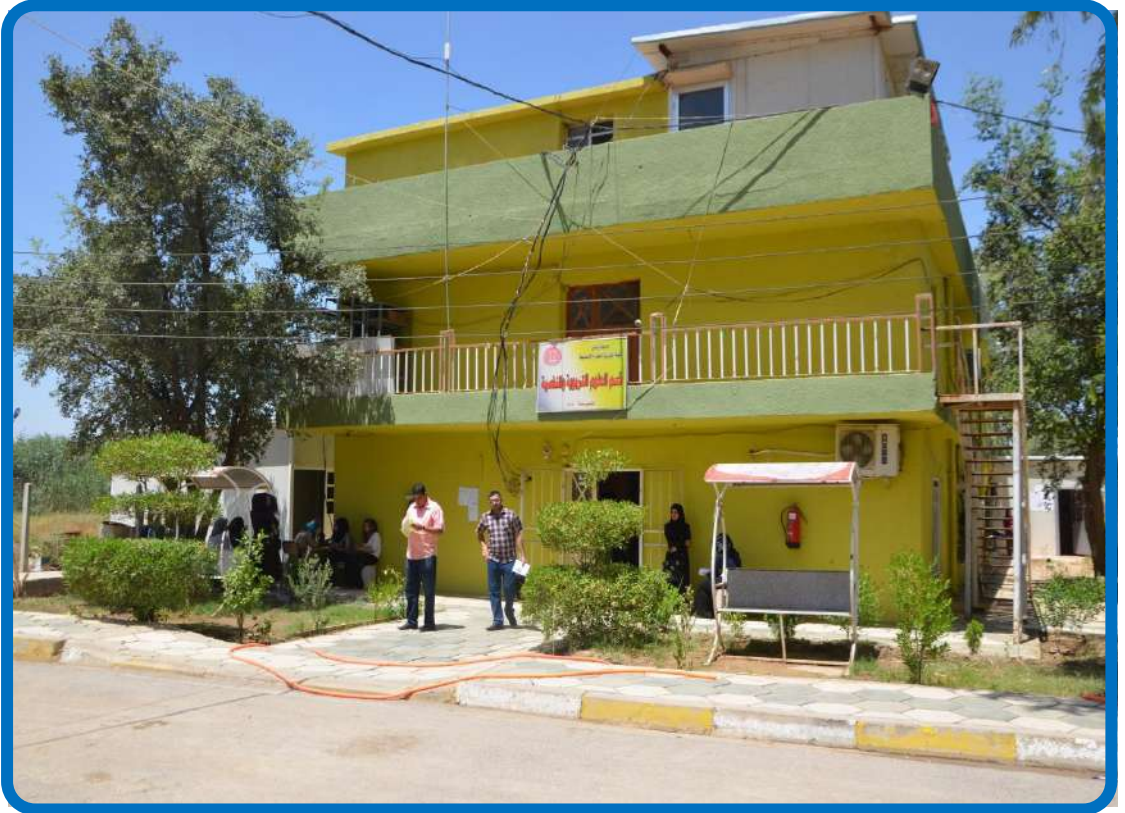
بناية قسم العلوم التربوية والنفسية