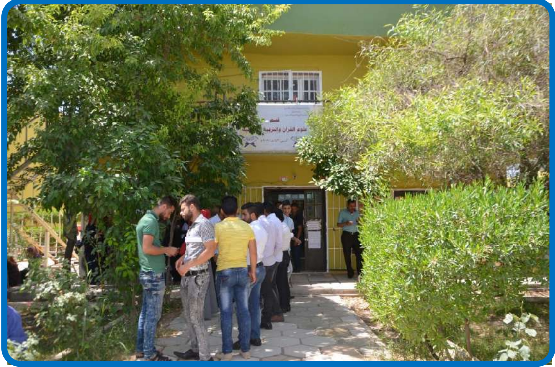
بناية قسم علوم القرآن والتربية الإسلامية