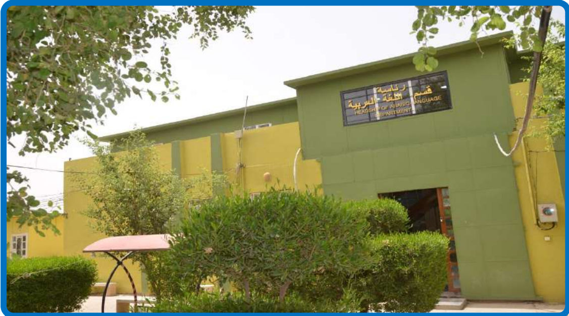
بناية قسم اللغة العربية