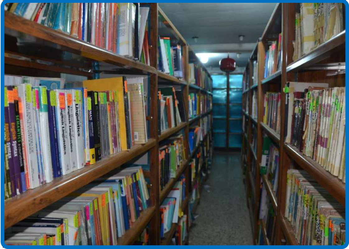
جانب من مكتبة الكلية من الداخل