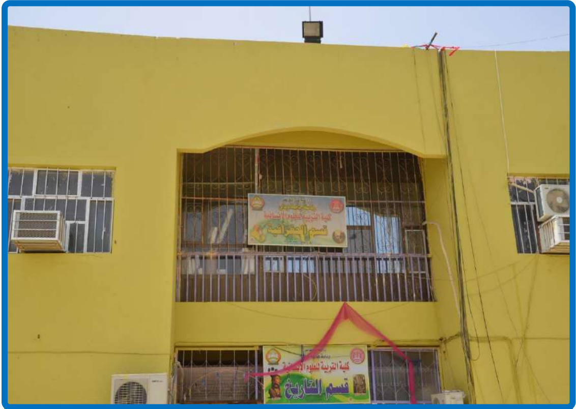
بناية قسمي التاريخ والجغرافية