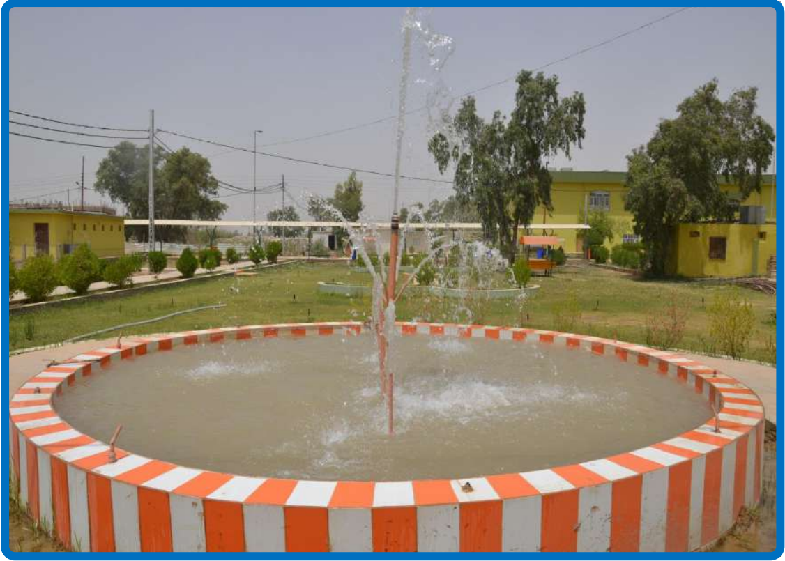
نافورة ماء وسط حدائق الكلية