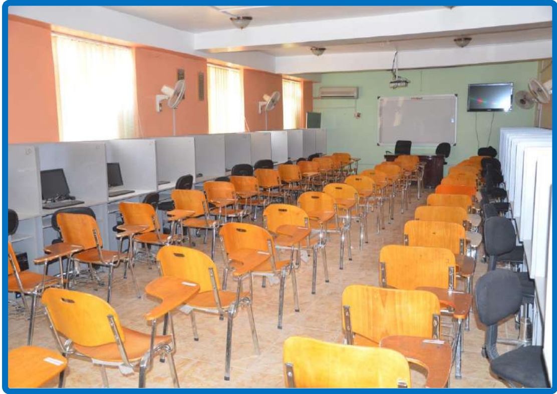
قاعة دراسية ومختبر