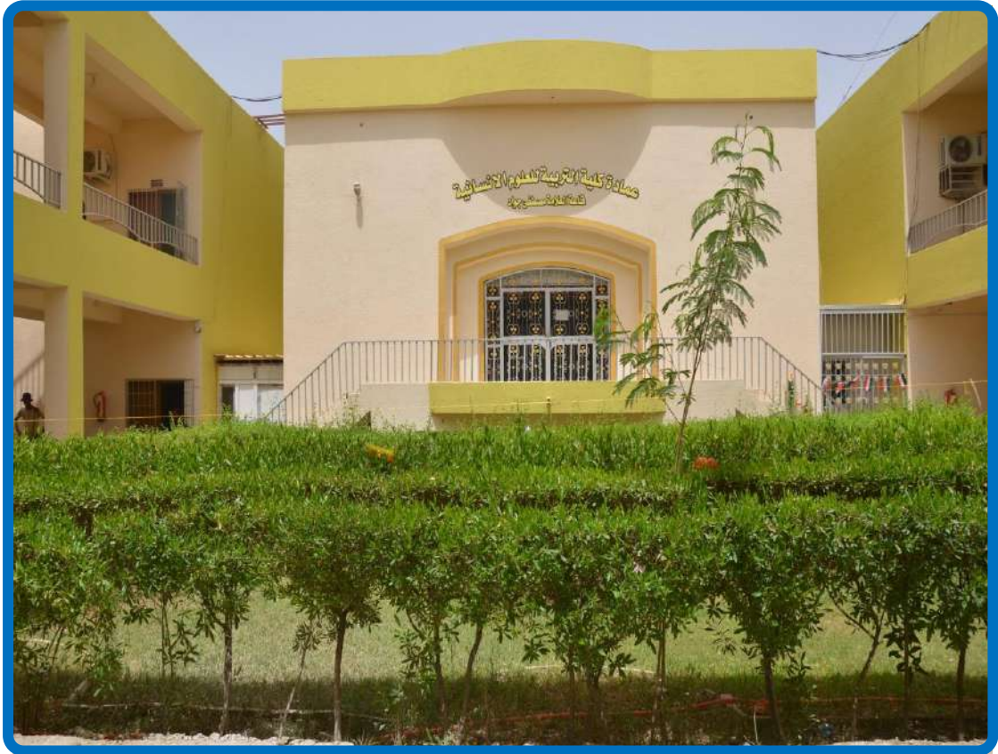
قاعة العلامة مصطفى جواد من الخارج