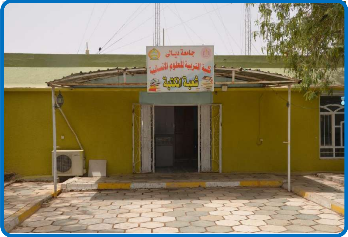
بناية مكتبة الكلية من الخارج