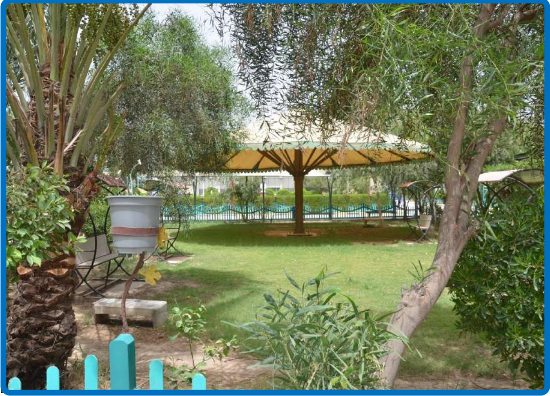
منظر جانبي لأحدى حدائق الكلية