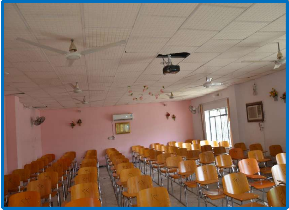
قاعة دراسات أولية (بكالوريوس)