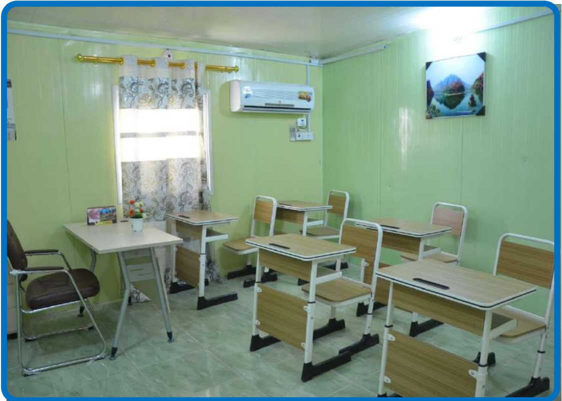
قاعة دراسات عليا حديثه (٢٠١٦م)