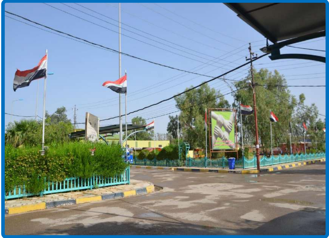
جانب من شوارع الكلية وحدائقها